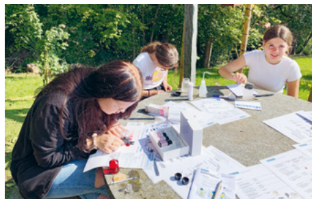
Die Wasserqualität wird chemisch analysiert.

Zurück in der Türggenau wurden dann die Resultate der Untersuchungen ausgewertet