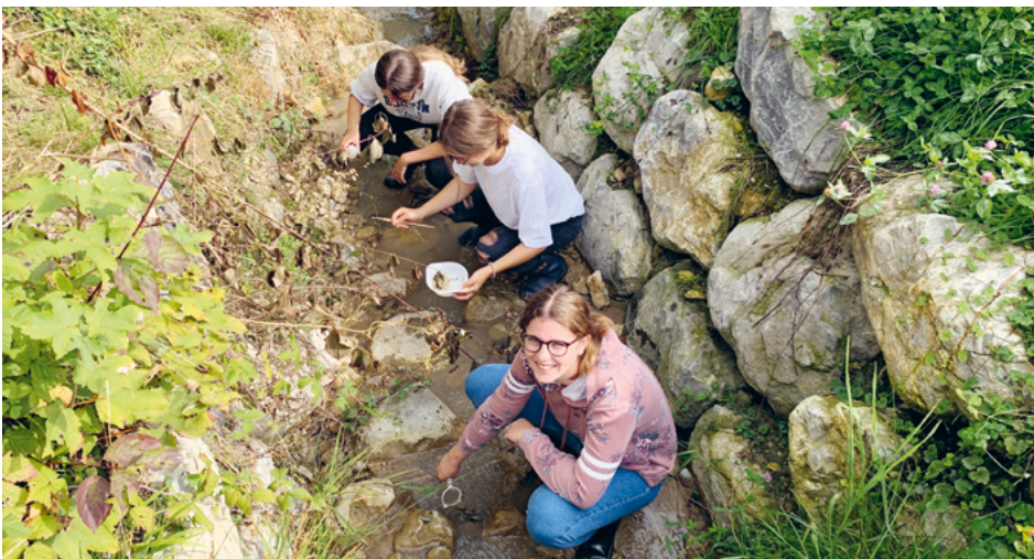
Die Schülerinnen suchen im Huebbach nach Leitorganismen.

Mit Gummistiefeln, Lupen und Keschern ausgerüstet, machten sich die beiden 3. Sekundarklassen der Oberstufe Türggenau Ende September auf den Weg nach Sax, um im Rahmen des NT-Unterrichtes zwei Fliessgewässer ökologisch zu untersuchen. Ein Ziel des neuen Lehrplans ist es nämlich, dass die Schülerinnen und Schüler wissenschaftliche Methoden kennenlernen, um beispielsweise Ökosysteme zu untersuchen und zu beurteilen. Konkret hiess dies: der Huebbach und der Farbbach wurden genauer unter die Lupe genommen.