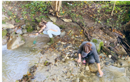
Auch im Farbbach werden Leitorganismen aufgestöbert.

ser nicht die gleich gute Bewertung wie der Huebbach. Umso erstaunlicher ist es, dass sich auch nach einem solchen radikalen Umbau des Gewässers nach kurzer Zeit wieder ein neues, intaktes Ökosystem aufbauen konnte. Dies zeigt, dass man aus Fehlern der Vergangenheit gelernt hat und Fliessgewässer nicht mehr kanalisiert, sondern versucht, ihnen einen möglichst natürlichen Verlauf zu geben.