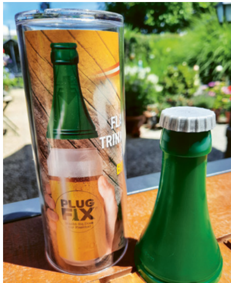
Für Bierdosen und Energy-Drinks

Einfach auf die Dose aufstecken und Trinkgenuss wie aus der Flasche erleben. Er passt auf die meisten gängigen Bier-, Energy- und Limo-Dosen und kommt mit einem vollwertigen Mehrwegtrinkbecher als Verpackung. Wie bei allen unseren Produkten verwenden wir CE-zertifizierte Kunststoffmaterialien, um die höchste Qualität zu gewährleisten.